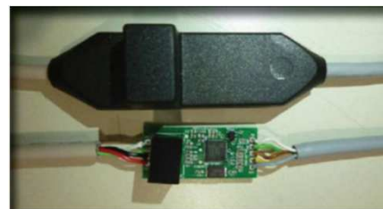
Protezione di schede elettroniche